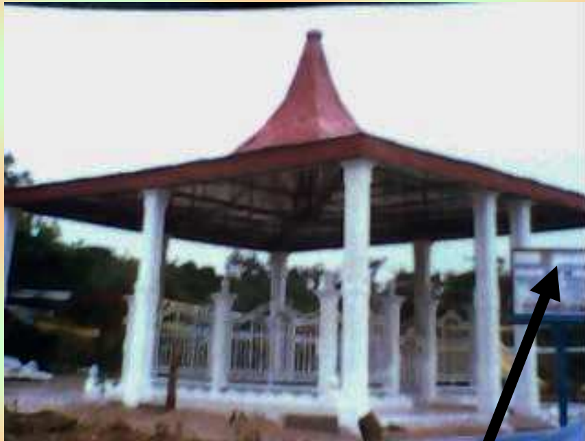
Lieu de L'Attentat : YALA TSANGAMANI